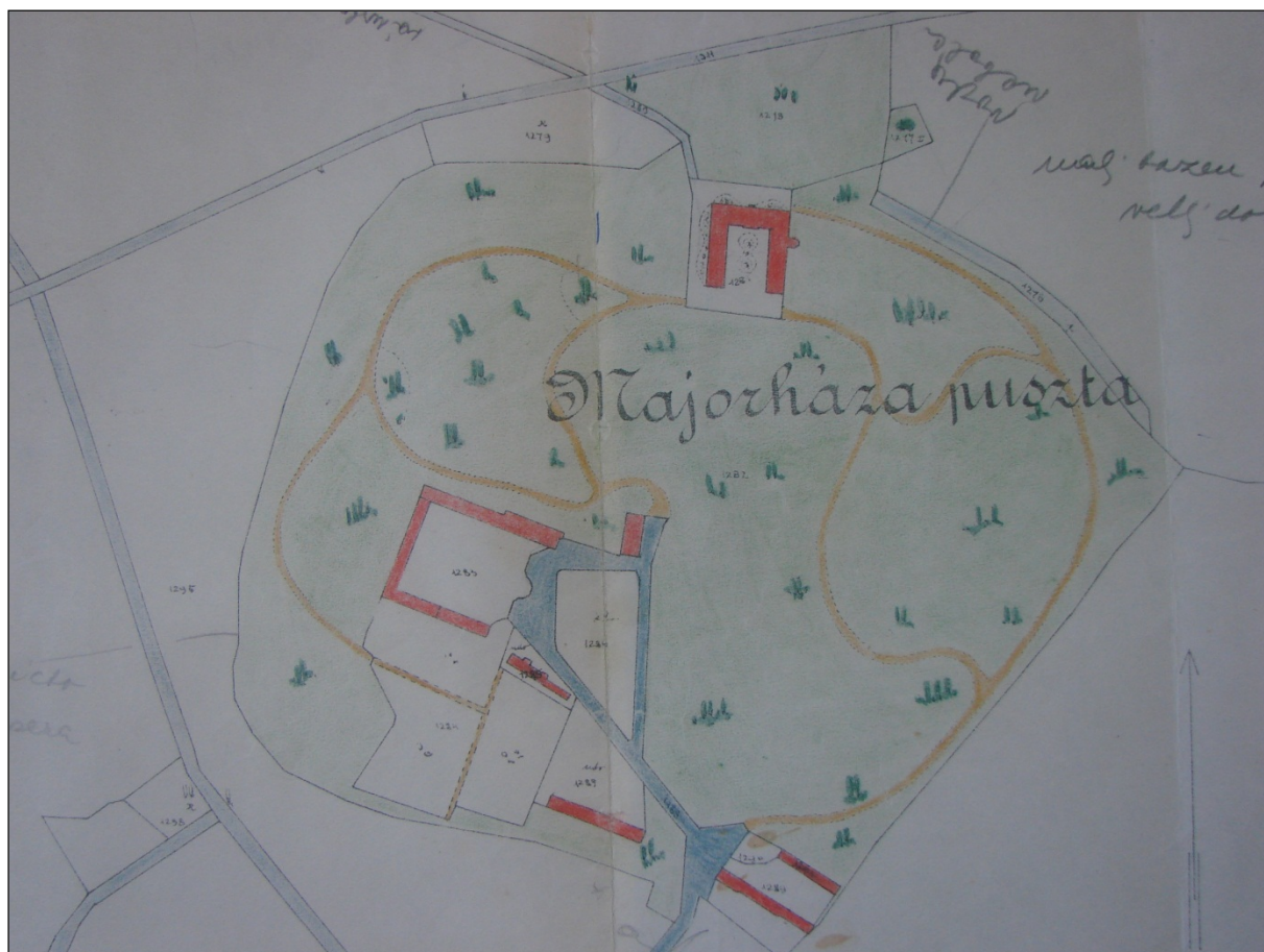
Katastrálna mapa okolia kaštieľa z prvej polovice 20. storočia.