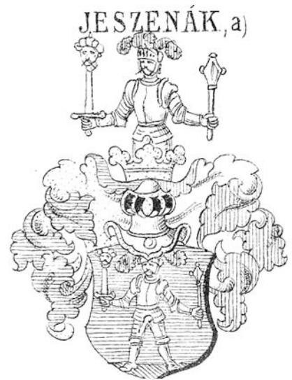
Erb rodu Jeszenákovcov