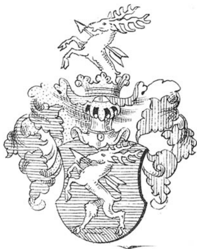
Erb rodu Draškóciocov