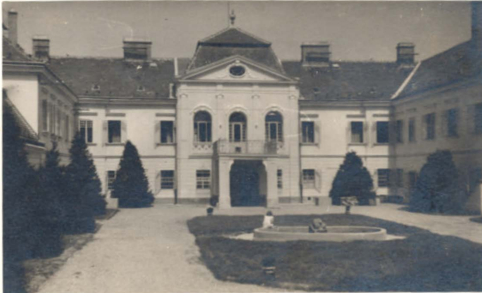
Kaštieľ v 40. rokoch 20. storočia