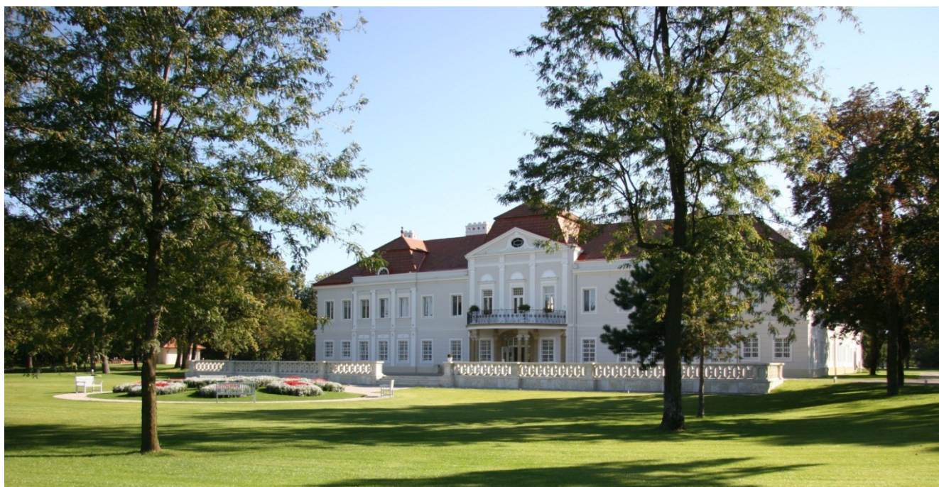
Vzhľad kaštiela v septembri 2011