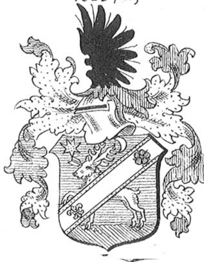
Erb rodu Vayovcov