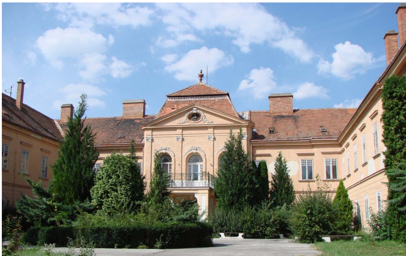
Nádvorie kaštiela v roku 2007, pár mesiacov pred začatím rekonštrukcie