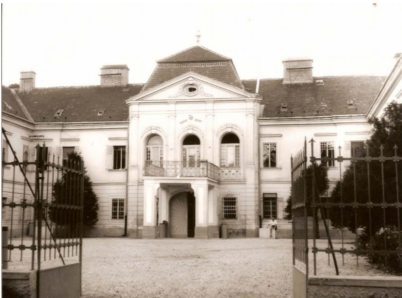
Kaštieľ s nápisom „Práci česť“

V roku 1953 je kaštieľ kompletne adaptovaný a do objektu je umiestnený nápravno-výchovný ústav pre chlapcov. Prízemné časti východného a západného bočného krídla boli nad hospodárskymi časťami nadstavané o druhé nadzemné podlažie. Keďže sa dostavba podriadila barokového charakteru objektu a dôsledne rešpektovala jeho pôvodné architektonické tvaroslovie, splynula s objektom a nenarušila jeho slohovú a štýlovú čistotu.